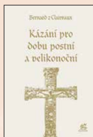
KÁZÁNÍ PRO DOBU POSTNÍ A VELIKONOČNÍ Bernard z Clairvaux Váz., 272 str., 330 Kč