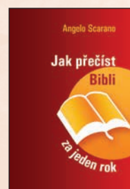
JAK PŘEČÍST BIBLI ZA JEDEN ROK Angelo Scarano Brož., 24 str., 35 Kč