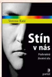
STÍN V NÁS Verena Kast Brož., 144 str., 289 Kč