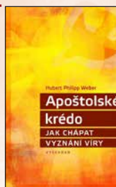
APOŠTOLSKÉ KRÉDO Hubert Philipp Weber Brož., 128 str., 212 Kč