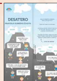
DUHA 10/2020 Lapbook, 25 Kč