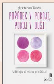
POŘÁDEK V POKOJI, POKOJ V DUŠI Gretchen Rubinová Váz., 224 str., 269 Kč