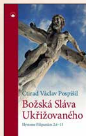
BOŽSKÁ SLÁVA UKŘIŽOVANÉHO Ctirad Václav Pospíšil Brož., 112 str., 179 Kč