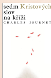
SEDM KRISTOVÝCH SLOV NA KŘÍŽI Charles Journet Brož., 164 str., 205 Kč