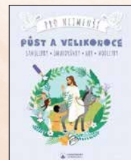
PŮST A VELIKONOCE PRO NEJMENŠÍ Léa Fabreová 28 str., 149 Kč