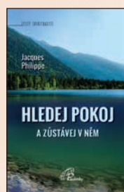
HLEDEJ POKOJ A ZŮSTÁVEJ V NĚM Jacques Philippe Brož., 104 str., 129 Kč