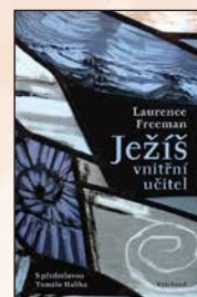
JEŽÍŠ - VNITŘNÍ UČITEL Laurence Freeman Brož., 328 str., 254 Kč