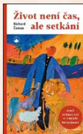
ŽIVOT NENÍ ČAS, ALE SETKÁNÍ Richard Čemus Brož., 200 str., 249 Kč