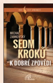
SEDM KROKŮ K DOBRÉ ZPŮVĚDI Michal Zamkovský Brož., 72 str., 125 Kč