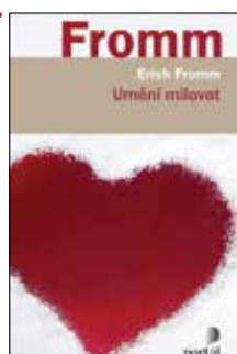
UMĚNÍ MILOVAT Erich Fromm Brož., 136 str., 235 Kč