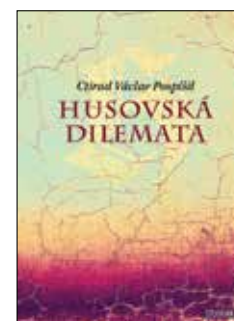
HUSOVSKÁ DILEMATA Ctirad Václav Pospíšil Váz., 320 str., 390Kč