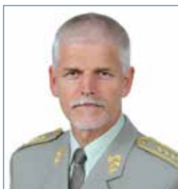
PETR PAVEL armádní generál

1) Tím prvním, co se mi vybaví, je osobnost kardinála Dominika Duky. Vážím si jeho otevřených postojů, vstřícnosti a lidskosti i určité sympatické civilnosti, se kterou vede katolickou církev. Díky jeho osobě, jeho vztahu k armádě a zejména k letectvu se nám v posledních letech podařilo nastavit opravdu těsnou a velmi otevřenou spolupráci mezi armádou a církvemi.