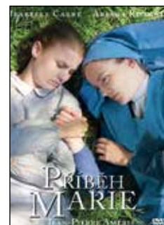
PŘÍBĚH MARIE DVD, 95 min, 199Kč