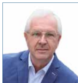
JIŘÍ DRAHOŠ předseda Akademie věd ČR

4) Nejsem Pražák a do Prahy do práce dojíždím, tak toto mohu jen těžko posoudit. Obecně však dnes vnímám význam církve především v rovině šíření a svým způsobem střežení základních hodnot naší společnosti.