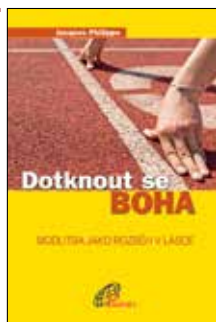
DOTKOUT SE BOHA Jacques Philippe Brož., 224 str., 198Kč