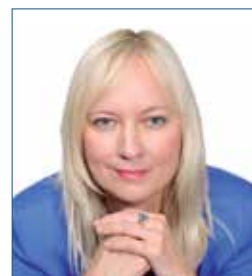
ALENA JEŽKOVÁ spisovatelka

4) Jedním z významných směrů působení církve ve veřejném prostoru jsou nesporně vzdělávací a výchovné aktivity. To je důležitá cesta k obecné kultivaci našeho veřejného života a v tomto směru mohou pražské arcibiskupství i Akademie věd, stejně jako řada dalších veřejných institucí, aktivně spolupracovat.