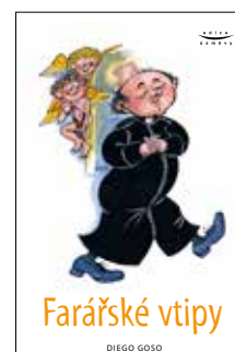
FARÁŘSKÉ VTIPY Diego Goso Brož., 127 str., 129Kč