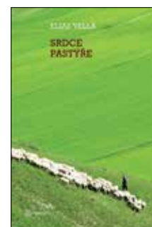
SRDCE PASTÝŘE Elias Vella Brož., 159 str., 239Kč