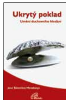
UKRYTÝ POKLAD José Tolentino Mendonça Brož., 112 str., 145Kč