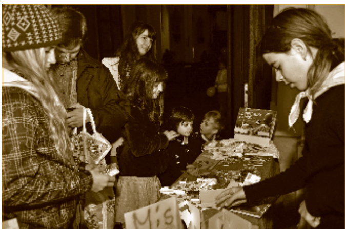
Misijní neděle v Kladně