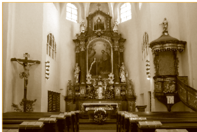
Interiér kostela sv. Benedikta