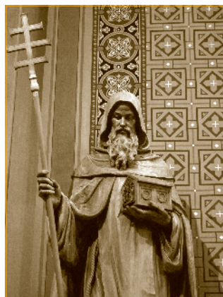
Sv. Cyril, Karlín