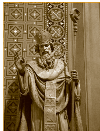
Sv. Metoděj, Karlín

Tak Karlín se změnil hodně, vlastně pořád se něco dělo. Jsme malá farnost, tak 12000 obyvatel, s velkým kostelem. Jsou tu sestry salesiánky, ty dělají krásnou práci s dětmi a s děvčaty, která nemají studijní předpoklady. Charita zde má azylový dům sv. Terezie, máme adopci na dálku a takové běžné věci diecézní.