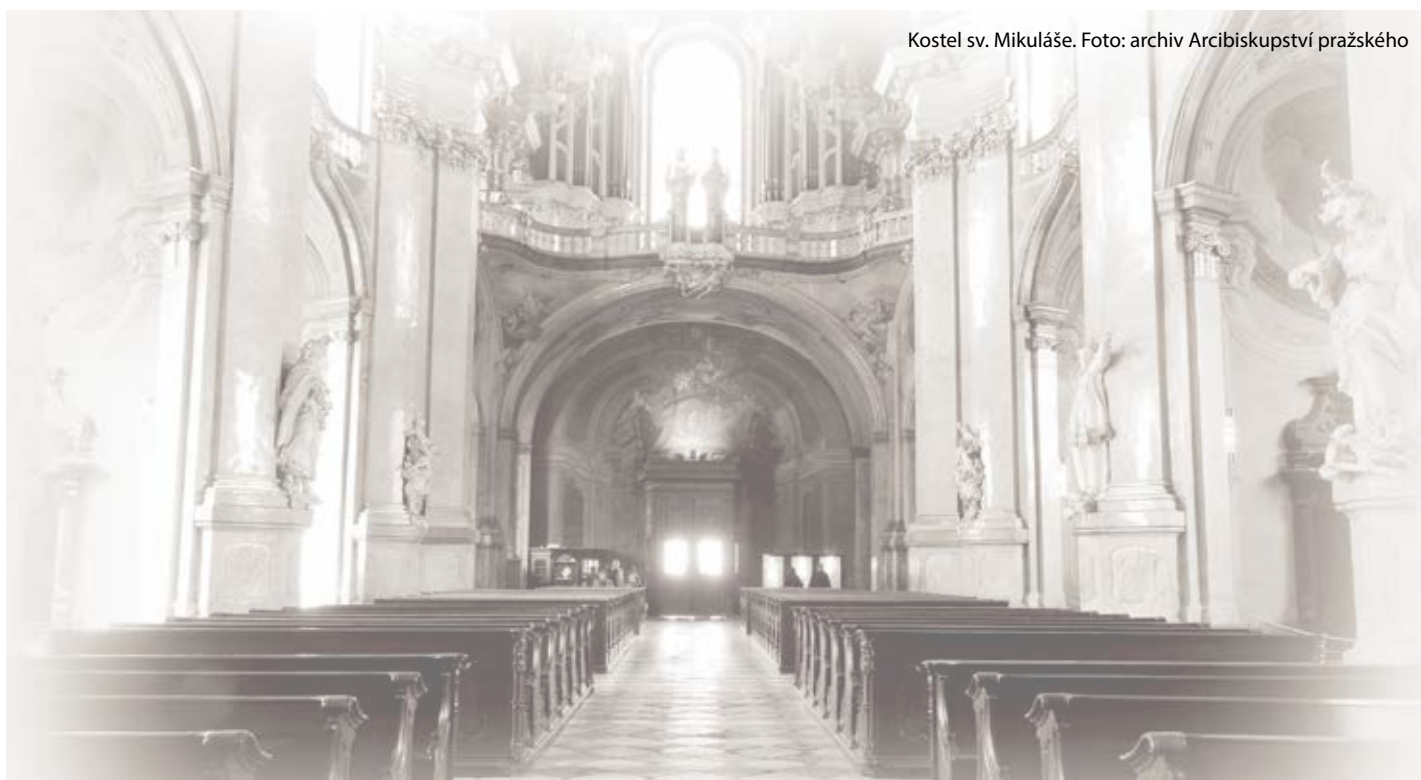
Kostel sv. Mikuláše.