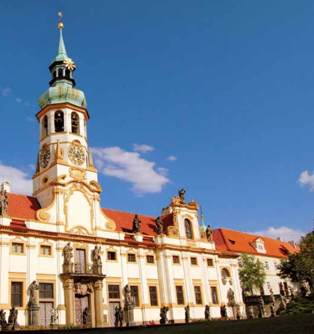
Pražská Loreta.

Metoděj její zbožné přání splnil. Kromě nádob zhotovil byzantský mistr i kovový obraz Panny Marie, který po Ludmilině mučednické smrti nosil při sobě její vnuk sv. Václav. Václav se stal v Boleslavi obětí