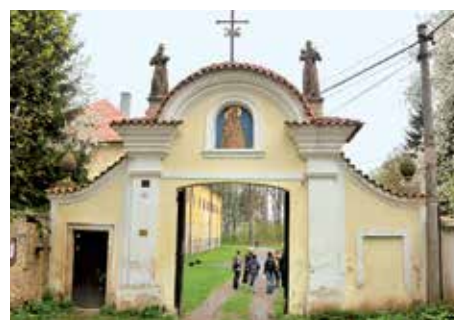
Hájek u Prahy.

svatyně a kapitula prosbě vyhověla. V areálu Hájku jsou dvě studny. První pramen se podle rukopisů zázračně objevil o hlavní pouti 8. září 1662. Později byla na jeho místě vyhloubena studna Panny Marie. Je za refektářem. Druhou studnu sv. Antonína vykopali severně od kaple Panny Marie Pomocné. Obě studny byly 21. srpna 1684 požehnány provinčním ministrem Bernardem Sannigem. Poutní cesta z Prahy do Hájku je lemována kaplemi. S jejich stavbou se započalo na sv. Antonína, tedy 13. června 1720. Připomínají nám zbožnost poutníků, která se projevovala již cestou na svatá místa do Hájku. Po válce bratři v hájeckém klášteře usilovali o pomoc odsunovaným Němkám, které byly soustředěny v sousedním statku. Snažili se zmírnit nelidské podmínky, ve kterých žily. Za období to-