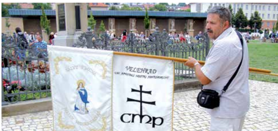
Před velehradskou bazilikou.