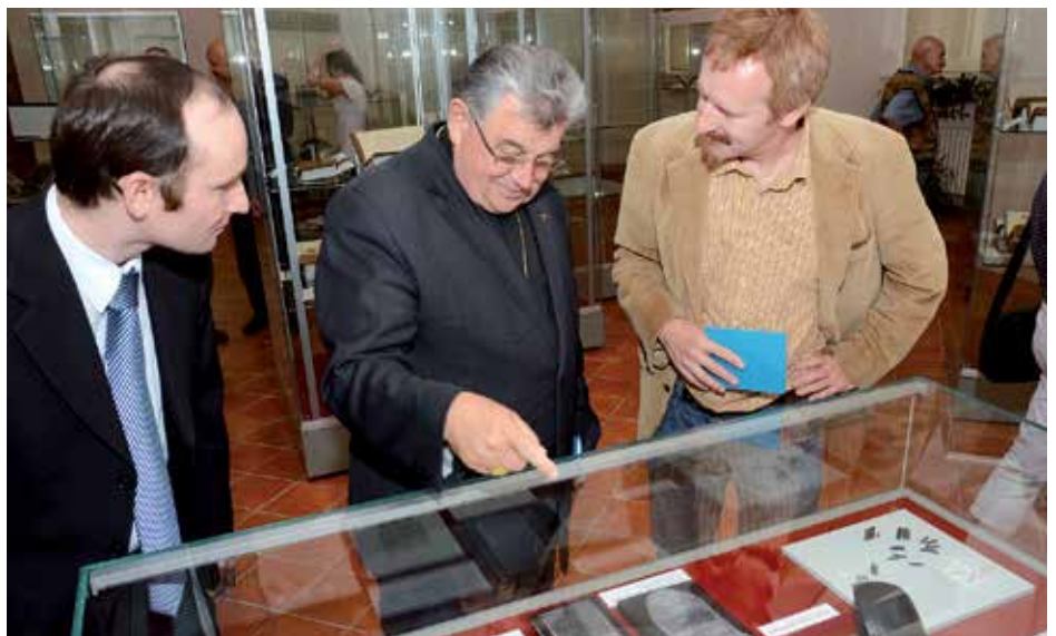
Vernisáž Bible kralické.