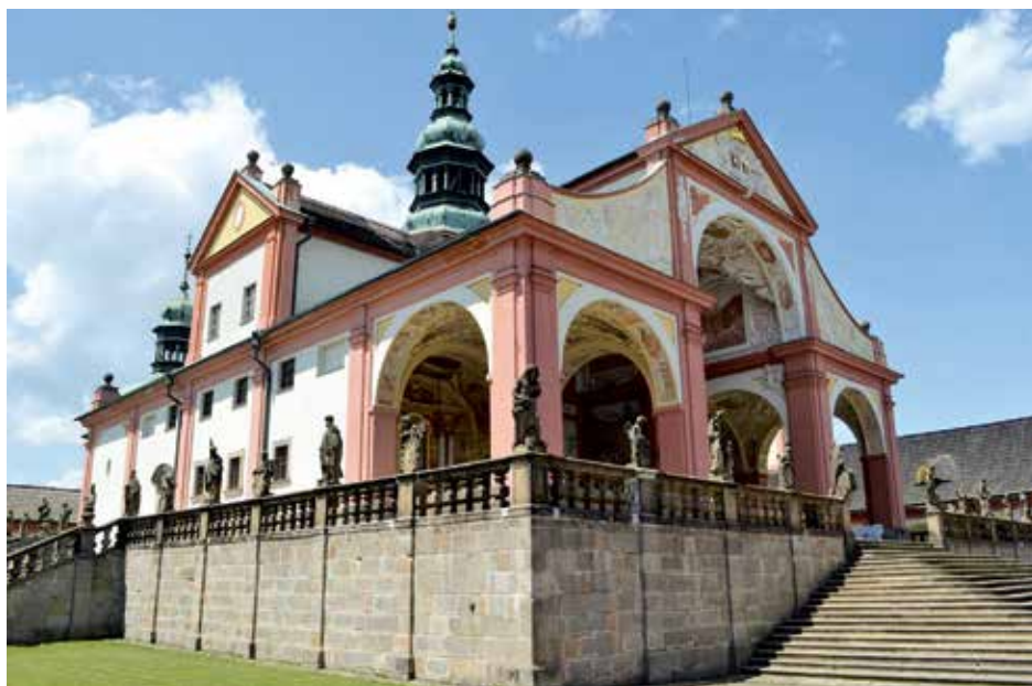
Svatá Hora.

Na pomyslné stupně vítězů musím také zařadit mariánský chrám ve Staré Boleslavi. A to nejenom proto, že jako litoměřický bohoslovec jsem toto překrásné poutní místo častokrát navštěvoval. Vždyť mariánská tradice tohoto místa sahá dle zbožných legend až k samé sv. Ludmile. Ta když byla sv. Metodějem pokřtěna, jak praví legenda, věnovala údajně sochy pohanských bůžků Metodějovi, aby z nich nechal zhotovit bohoslužebné nádoby. Sv.