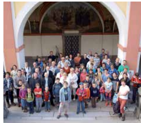
Pouť za P. Radima Cigánka.