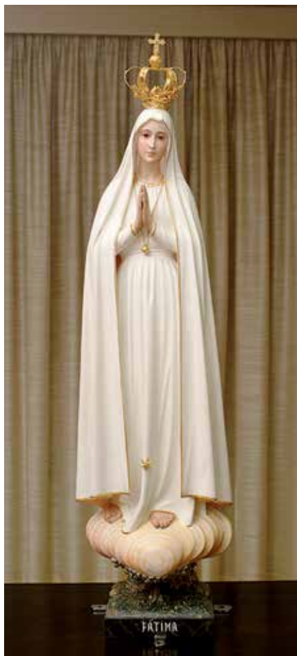
Panna Maria Fatimská

K romě Říma žádné jiné poutní místo není tak spojeno s nástupci Petrovými jako Fatima. První zjevení Panny Marie, 13. května 1917, bylo v den, kdy pozdější papež Pius XII. byl vysvěcen na biskupa. Při 25. výročí prvního zjevení, 13. května 1942, Pius XII., uprostřed hrůz druhé světové války, na základě fatimského zjevení zasvětil svět Neposkvrněnému Srdci Panny Marie. Dne 13. května 1981 byl spáchán atentát na Jana Pavla II., který byl při něm smrtelně zraněn. Lékaři žasli nad tím, jak střela v těsné blízkosti minula několik životně důležitých míst, jejichž poranění by způsobilo bezprostřední smrt. Papež na to řekl. „Jiná ruka střílela a jiná ruka řídila dráhu střely; ruka Panny Marie, v jejímž výročním dnu se to stalo“. 14. března 1984 byla socha Panny Marie Fatimské poprvé přenesena do Říma na Svatopetrské náměstí před chrám sv. Petra. Před ní papež za obrovské