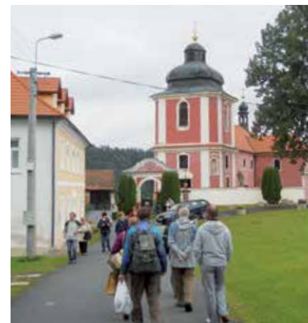
Pouť do Hrádku.