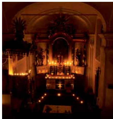
Kulturní osmičky.