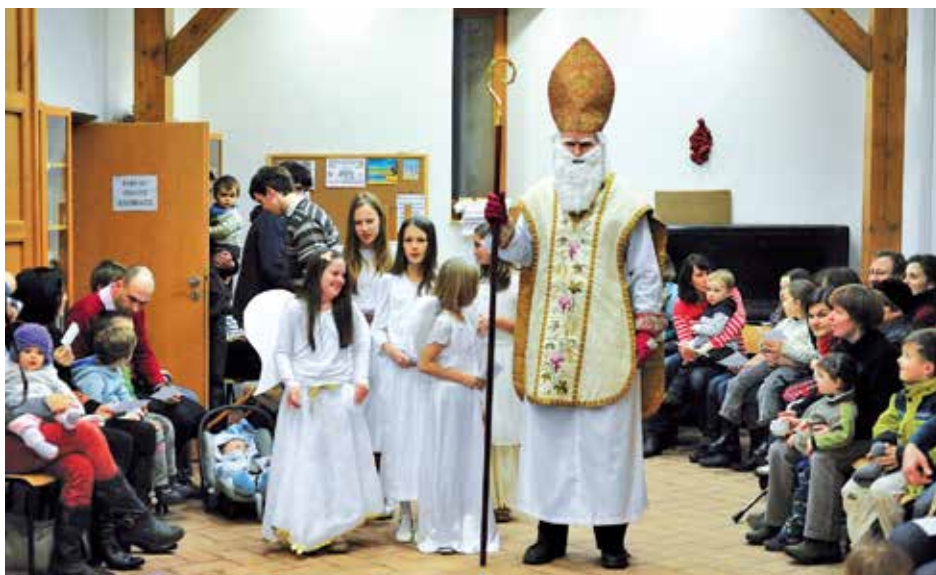
Mikuláš 2012, Praha-Liboc.

„Farní oslavy sv. Mikuláše jsou pěknou a dnes poměrně častou rozvíjenou tradicí,“ dovídáme se od Lenky Jeřábkové z katechetického střediska. „Zpravidla po mši o nejbližší neděli navštíví tento biskup se svým andělským doprovodem farní shromáždění. Farnosti často zvou i děti s rodiči, kteří nenavštěvují kostel vůbec nebo jen sporadicky, aby se zúčastnili mikulášské nadílky a třeba i některé společné dětské aktivity. Individuální „vystoupení“, která známe z mikulášských návštěv v rodinách, může nahradit např. scénka za života sv. Mikuláše, kterou děti sehrají, oblíbené jsou i tematické nebo adventní písně atd. Mikuláš pak všechny děti bez rozdílu obdaruje. A když se děti začnou ptát na čerta? V každé farnosti to Mikuláš řeší jinak: někde ho nechává přivázaného u stromu za vesnicí, někde mu ani nedovolí vyjít z pekla... ale vždy jim vysvětlí, že čert do kostela nepatří!“