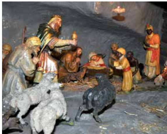
Betlém v kostele sv. Václava.