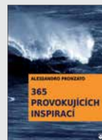
Alessandro Pronzato 365 PROVOKUJÍCÍCH INSPIRACÍ Váz., 304 str., 299 Kč