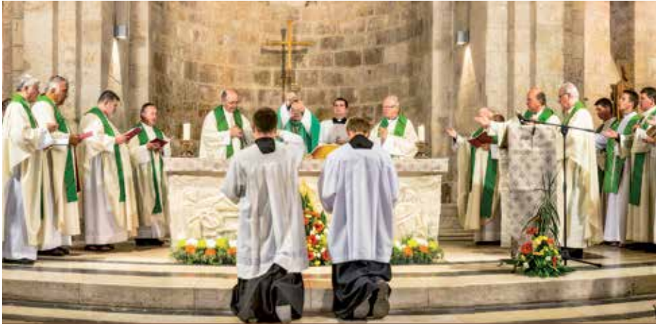
Nedělní mše svatá v kostele sv. Anny v Jeruzalémě.

Národní pouť do Svaté země očima účastníka.