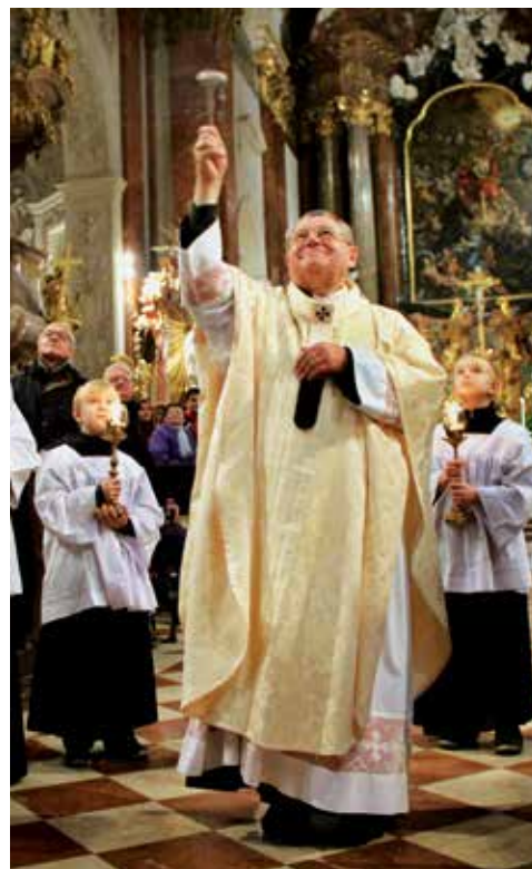
Žehnání varhan. Kardinál Dominik Duka.