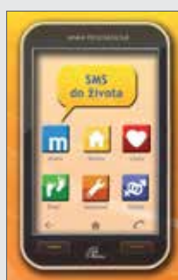
Janka Procházková SMS DO ŽIVOTA Brož., 24 str., 35 Kč