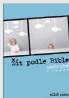
Miloš Szabo ŽÍT PODLE BIBLE podruhé s Janem Váz., 400 str., 235 Kč