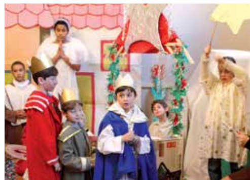
Slavení – španělská komunita.

Nikdy není špatné podívat se na sebe sama cizíma očima. Člověk se o sobě leccos dozví a lépe porozumí tomu, co se může na první pohled zdát jako zcela samozřejmé. Prostřednictvím malé ankety jsme se pokusili zjistit, jak kněží cizinci vidí „naše“ Vánoce. Co je překvapilo, když k nám přišli, a jak se oslava Vánoc liší od slavení v jejich zemi? Jak Vánoce u nás slaví zahraniční komunity, o které tito kněží pečují?