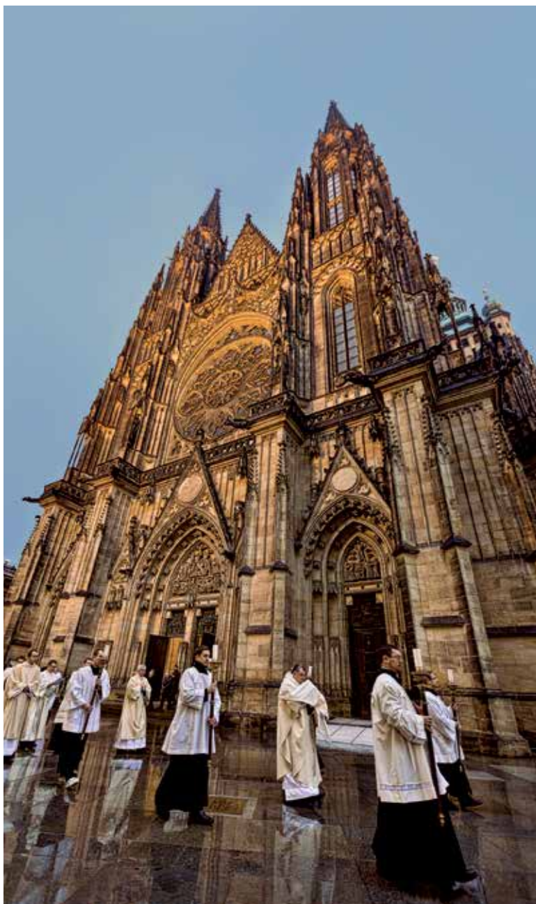
Katedrála a živá setkání.

Výstava je otevřena o víkendech a svátcích od 11.00 do 18.00, ve všední dny od 11.00 do 15.00. Vstup zdarma.