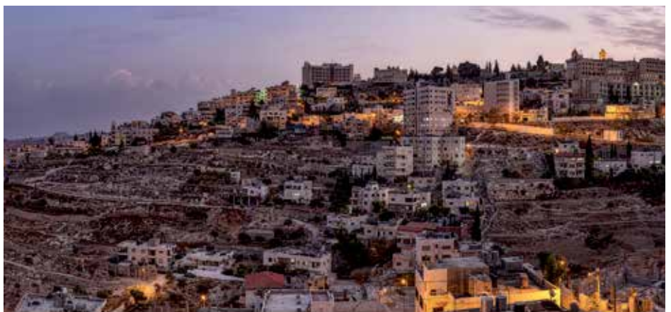
Večerní Betlém.

Štěpán Filipec farnost Panny Marie před Týnem, Praha