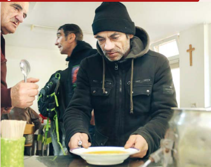
Mezi lidmi bez domova je zhruba 70–75 % mužů.

✿ Setkal jste se během své praxe i s lidmi, kteří nepatří do těchto skupin, ale naopak měli v minulosti dobré