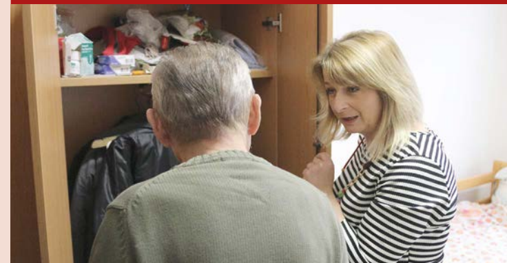
Člověk bez domova, který využívá charitní služby, nemusí trpět hladem, mrazem, má zázemí k osobní hygieně. Může obstat v běžných společenských situacích a najít si práci.

zemí, které Charita nabízí lidem bez přístřeší v Praze-Karlíně: azylový dům, noclehárnu a nízkoprahové denní centrum, které je připraveno otevřít během mrazů i v noci, aby mohli lidé přečkat noc na „teplé židli“. ○